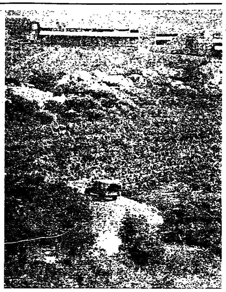
شاحنة للعدو قرب الحدود اللبنانية

تكرت وكالة الأنباء الفلسطينية (وفا) أمس، أن بريجنيف سكرتير عام الحزب الشيوعي السوفياتي اجتمع أمس الأول مع السيد ياسر عرفات رئيس منظمة التحرير الفلسطينية.